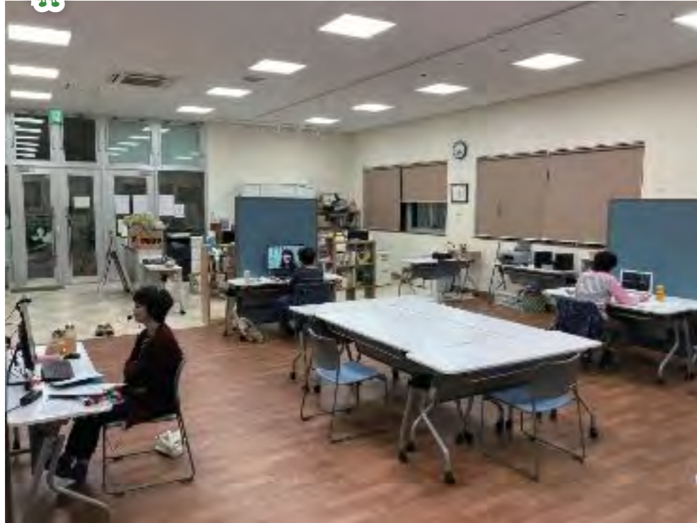
Zoomを利用することで開催が可能になったファシリテーション講座。net環境が無い受講生はまちスポから参加した。

コロナ禍の2020年度 まちづくりスポット恵み野の活動は試行錯誤のくり返してした。